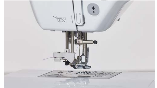
Sistema avanzato di infilatura