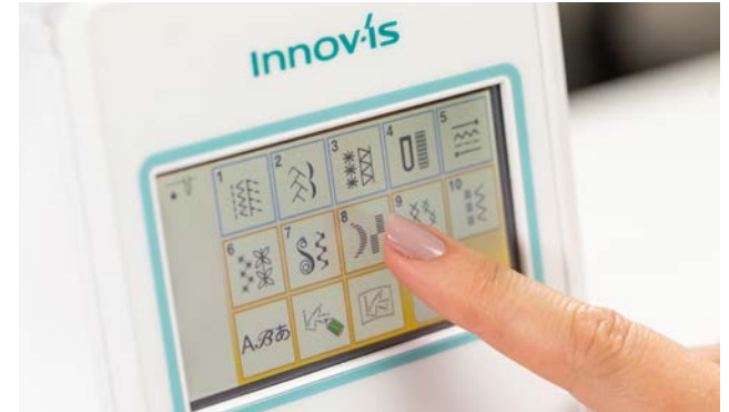
Touchscreen LCD a colori