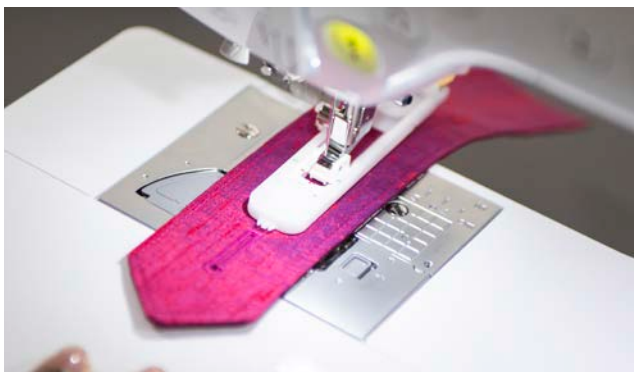
Asola automatica in un'unica fase con 10 stili