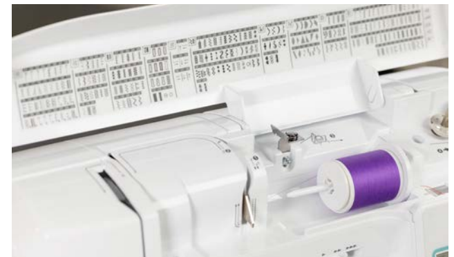
241 punti di cucito e decorativi incorporati